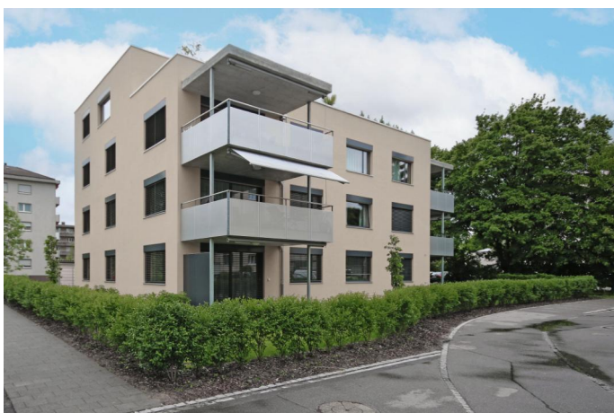
Ansicht von Nordwesten