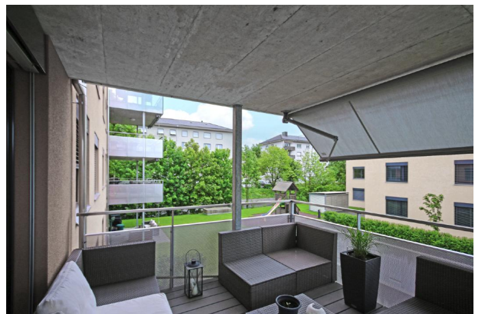
Gedeckter Balkonsitzplatz mit VPC-Dielen