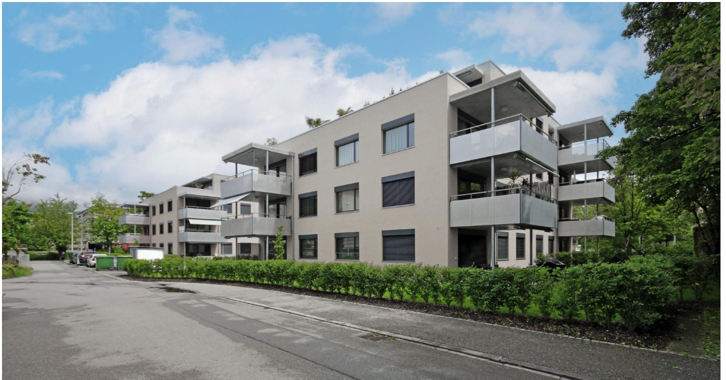
Blick von Südwesten