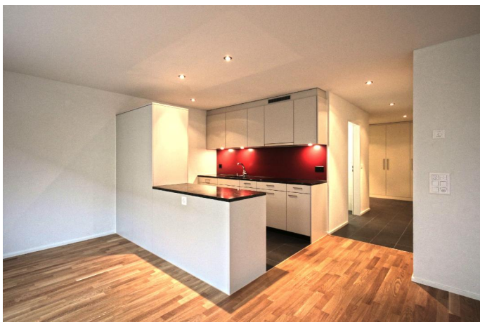
Wohnbereich einer 3.5 Zimmerwohnung